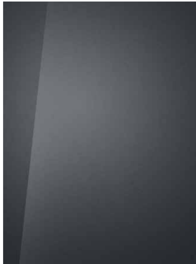
Aurora Gray (micalizzato)