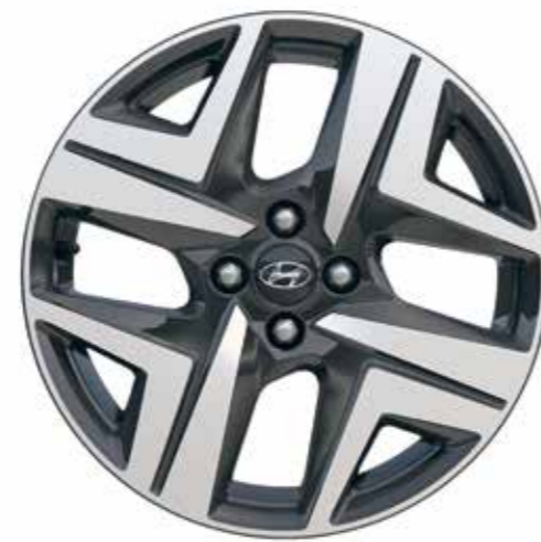
Cerchi in lega da 17"