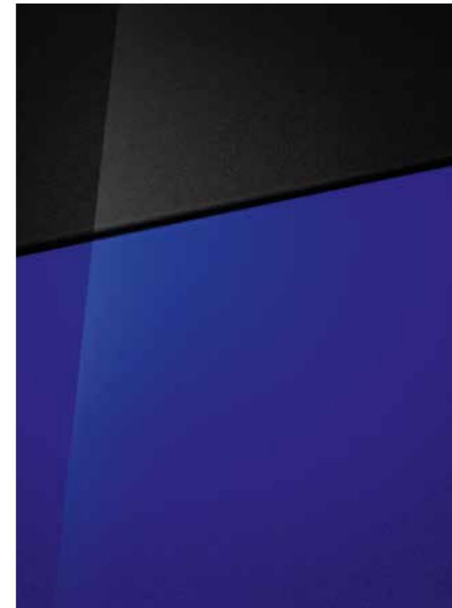
Intense Blue (micalizzato) con tetto Phantom Black