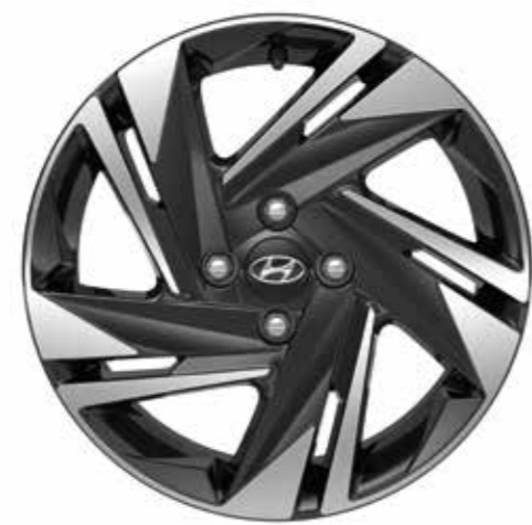
Cerchi in lega da 16"