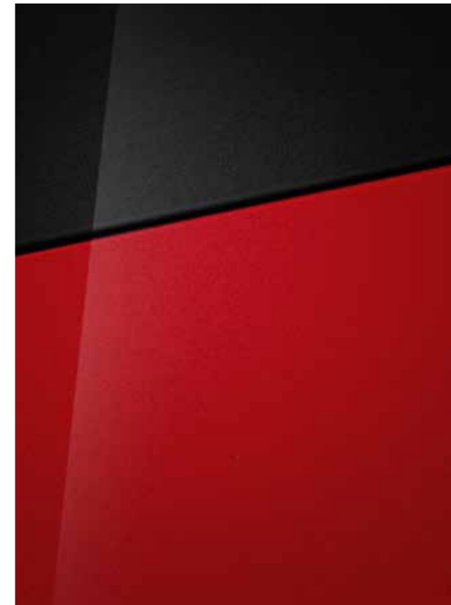
Dragon Red (micalizzato) con tetto Phantom Black