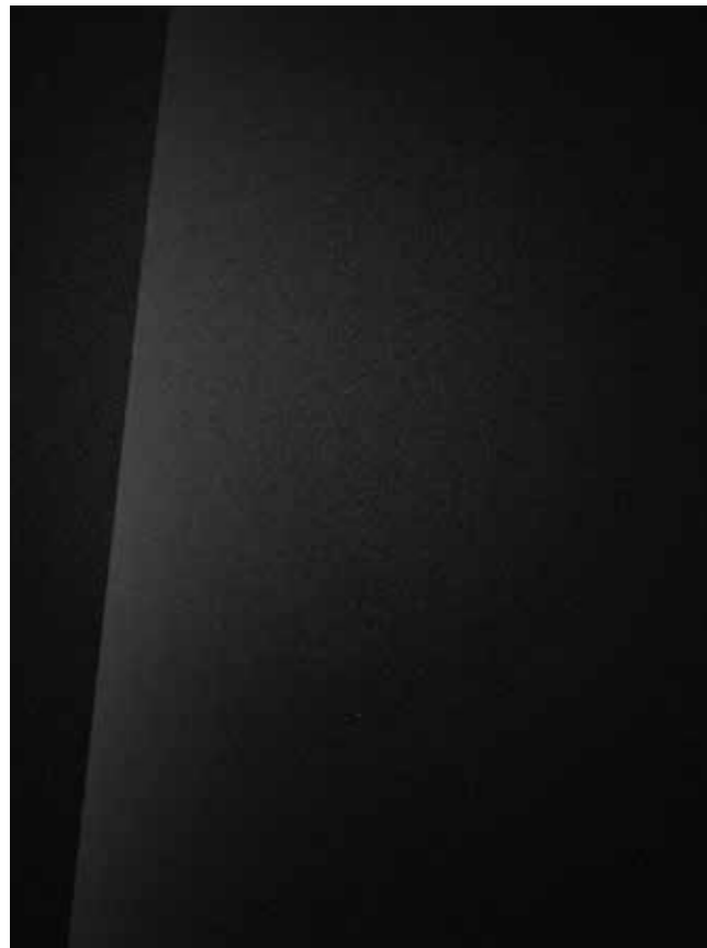
Phantom Black (micalizzato)

Libera la tua creatività. Puoi scegliere tra nove colori esterni per completare la silhouette accattivante della tua BAYON. Inoltre, il tetto bicolore e gli specchietti retrovisori combinati in Phantom Black ti permettono di personalizzare ulteriormente le combinazioni di colore per creare un'auto perfettamente rispondente ai tuoi gusti personali.