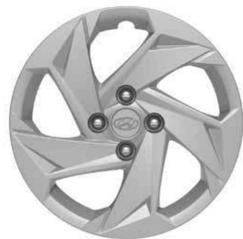
Copri cerchi da 15"

BAYON è disponibile con cerchi in lega bicolore da 16" e 17".