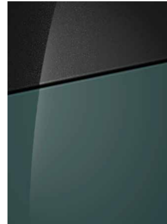
Mangrove Green (micalizzato) con tetto Phantom Black