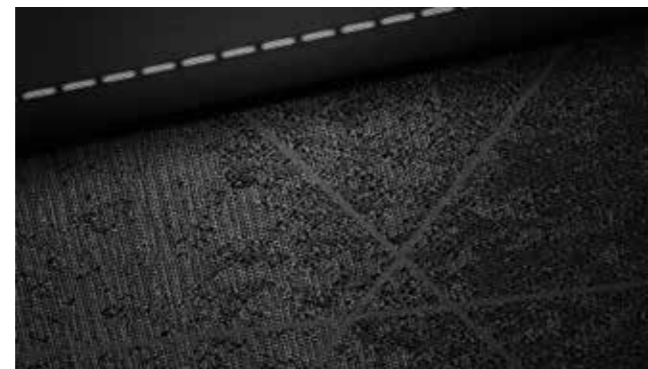
Tessuto nero con cuciture grigie