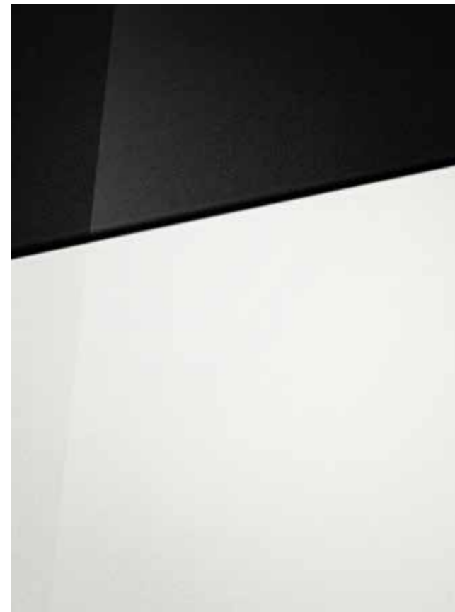
Atlas White (pastello) con tetto Phantom Black